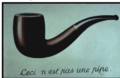
Figuur 2 René Magritte

Wat hierdie foto's aangrypend maak, is wat Barthes 8 beskryf as iets wat deel is van die essensie van die aard van fotografie, naamlik dat die objek wat die kyker sien werklik bestaan het en dáár was waar die kyker hom of haar op die betrokke foto waarneem. So 'n foto bring die aanskouer dus op 'n akute wyse in bykans reële aanraking met die dood (van iemand). Die lig wat uitgegaan het van daardie dooie persoon en eens op 'n tyd vasgevang is deur ligsensitiewe silwer halogeen, is lig wat nou weer van die foto af uitgaan en op die kyker se blik val. Tyd, of eerder die tydelikheid van tyd, sterflikheid, dring deur die kyker se pupil tot op sy/haar iris. En dít op 'n ander wyse as 'n skildery of beeldhouwerk van 'n dooie persoon wat steeds 'n element van fiksie inhou. Daar is altyd nog die moontlikheid dat dit nie presies so daar uitgesien het nie. Die dood van die subjek in postmortem fotografie is egter geen fiktiewe aangeleentheid nie. Volgens Barthes is 'n foto nooit van sy referent te onderskei nie en 'n pyp hier altyd 'n pyp. 9 En volgens Grimes 10 is die aanskouing van 'n lyk se gesig altyd 'n roerende ervaring. Tog sien 'n mens ook deur hierdie foto's iets van die misterie van lewe en ervaar die kyker ten aanskoue van so 'n foto iets van Van Wyk Louw se versreël, "mooi is die lewe en die dood is mooi". 11