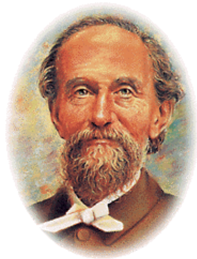
Figuur 5 Portret van Andrew Murray snr.

Alhoewel die idee van “heiliges” soos wat dit in die geskiedenis van die Christelike liturgie gebruik is, asook die verering van voorouers soos wat dit binne die Afrika-konteks voorkom, vreemd is aan die gereformeerde tradisie, het die gereformeerde kerke en vele ander protestantse denominasies tog op 'n eie outentieke wyse mense vereer. 'n Spesifieke voorbeeld is die dominee-portrette wat in die meeste konsistories van die NG Kerk in Suid-Afrika voorkom, asook die portrette van die hoogleraars teen die mure van byvoorbeeld die Fakulteit Teologie van die Universiteit van Stellenbosch. Hierdie portrette dien nie net as dokumentasie van wie as leraars en hoogleraars gedien het nie, maar oefen ook 'n invloed uit op diegene wat die portrette sien deur middel van visuele kommunikasie. 40