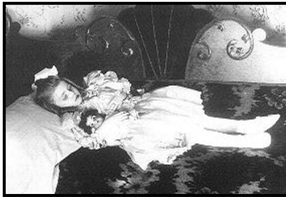
Figuur 1: Postmortem foto

Postmortem fotografie was wydverspreid in Europa en die VSA gedurende die negentiende eeu, 3 en gevolglik ook in Europese kolonies soos Suid-Afrika. Hierdie foto's se subjekte is lyke en is op verskillende wyses gefotografeer. Die eerste meegaande foto is die dié van 'n meisietjie wat geneem is in die negentiende eeu. Hierdie voorbeeld (figuur 1) was een van die meer algemene tipes. Eerstens was die meeste foto's uit hierdie periode van kinders vanweë die hoë persentasie kindersterftes, tweedens was die subjek op 'n bed gefotografeer, derdens is die meisietjie versorg in terme van byvoorbeeld kleur op haar wange, mooi klere, en laastens is sy uitgebeeld asof sy slaap. 4